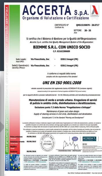
UNI EN ISO 9001:2008