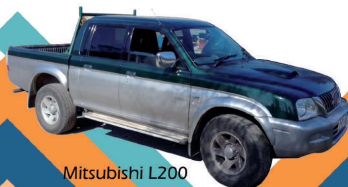
Mitsubishi L200 con gancio da traino