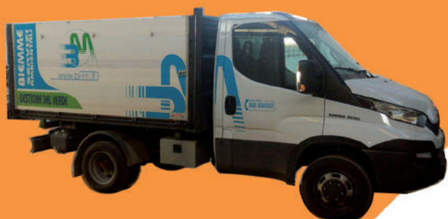
Autocarro Iveco 35 con ribaltabile