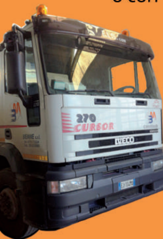
Autocarro Iveco Euro Tech 270 con scarrabile