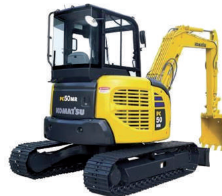
Escavatore Komatsu PC 50 Q dotato di Polipo Forestale