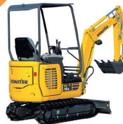
Escavatore Komatsu PC 16 Q/EXPR dotato di Martello Pneumatico