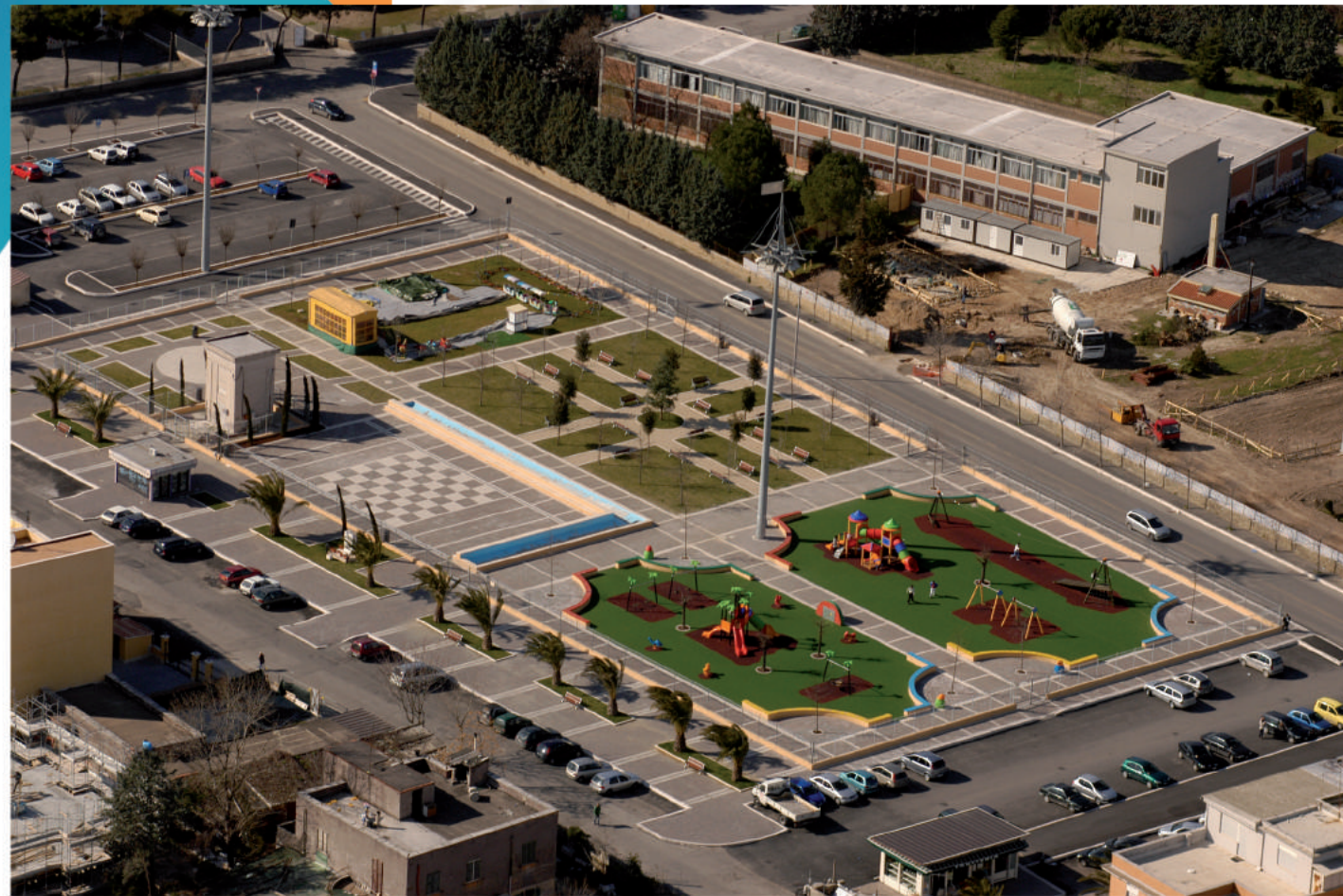
Parco realizzato nel Comune di Tivoli