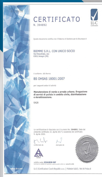
BS OHSAS 18001:2007