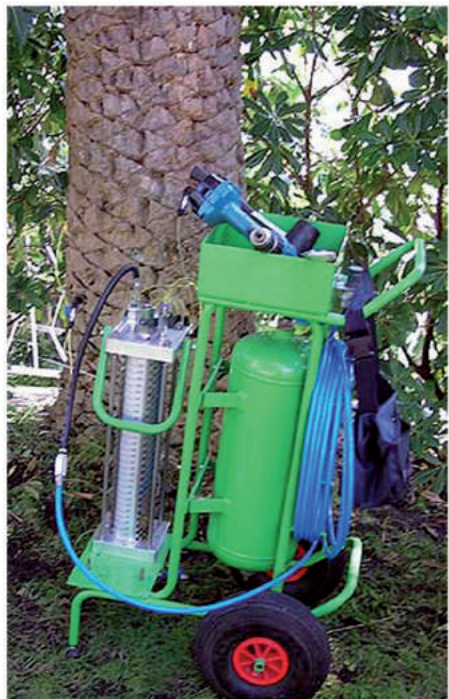
Trattamento di endoterapia