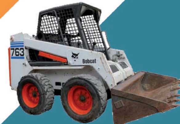
Bobcat 763 dotato di miscelatrice, taglia asfalto o trincia