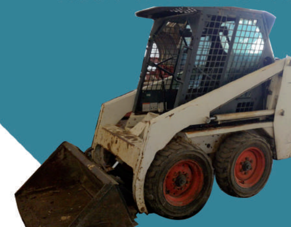
Bobcat Mini dotato di pala o forche a uso muletto