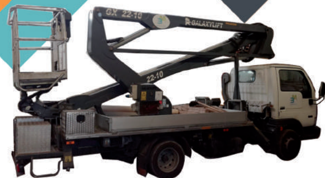
Piattaforma Aerea Nissan Cabstar H max mt.22