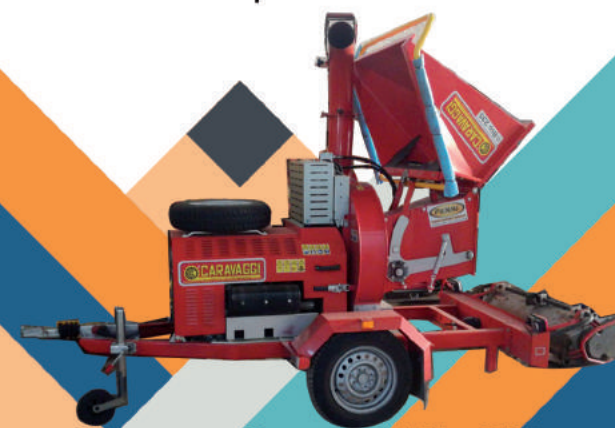
Cippatore Caravaggio Bio 235

Altri mezzi e attrezzature a disposizione dell'azienda: