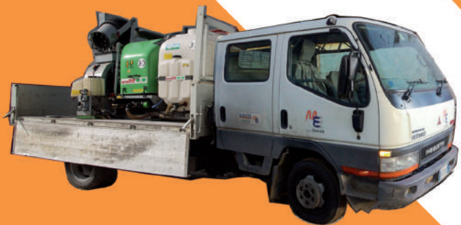
Mitsubishi canter con nebulizzatori Tifone 90HP 10Ugelli o con ribaltabile