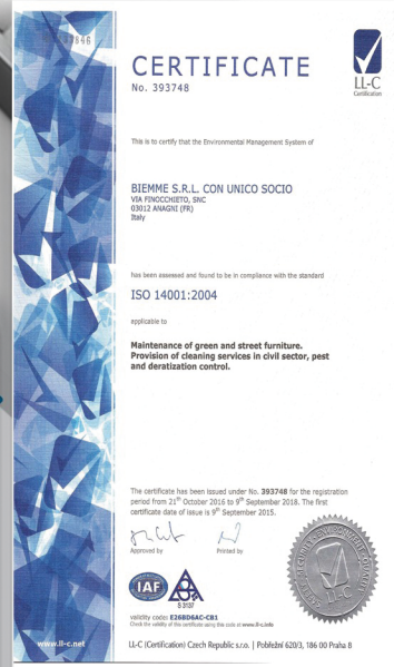
UNI EN ISO 14001:2004