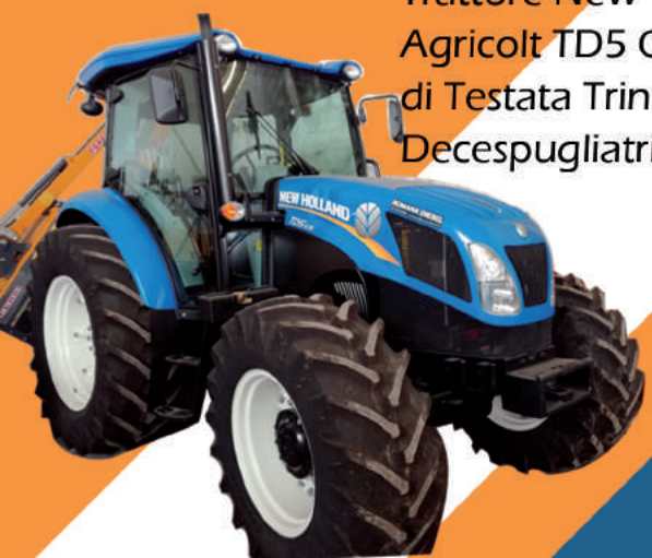
Trattore New Holland Agricol TD5 CAB dotato di Testata Trinciante e Decespugliatrice idraulica