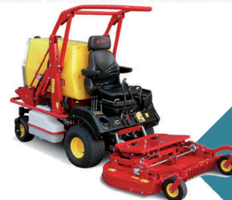
Tosaerba Ferrari 22 HP Diesel