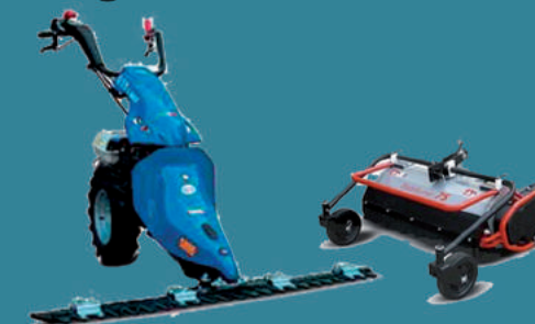
Motofalciatrice a scoppio BCS Idrostatica dotata di barra falciante o bladerunner